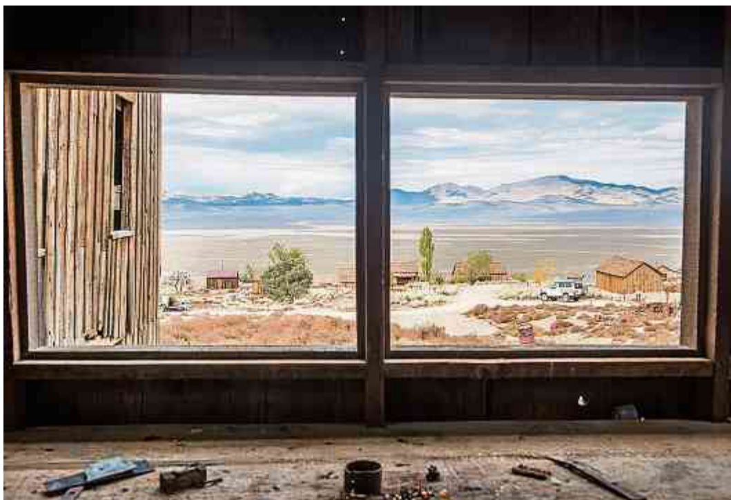
Die verfallene Mine «Berlin» mitten in der endlosen Wüste Nevadas.