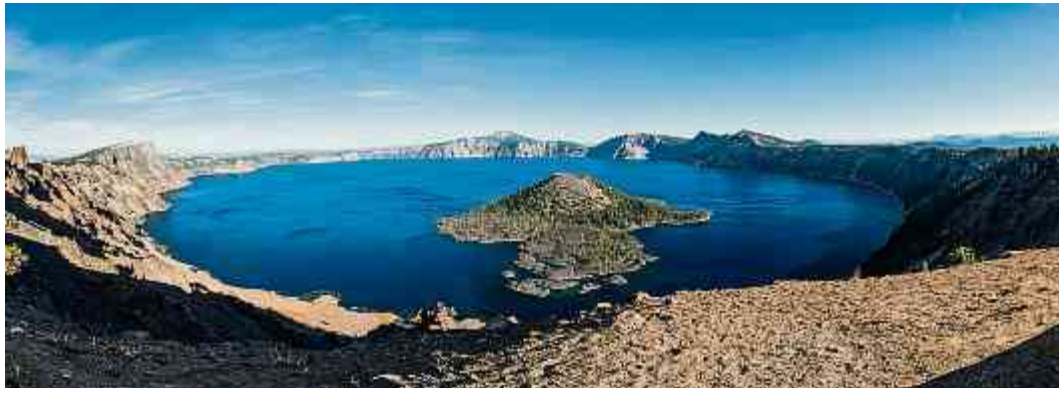
Der tiefblaue «Crater Lake», ein Kratersee im Süden des Bundesstaates Oregon.